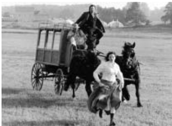
The Outdoor Donnellys, Blyth Centre for the Arts

« Traditionnellement, le fait d'attirer du soutien relativement à de nouvelles initiatives présente un dilemme pour les organismes de bienfaisance oeuvrant dans le domaine des arts. Il faut faire ses preuves pour obtenir du soutien, mais il faut obtenir du soutien pour pouvoir faire ses preuves. Cela étant dit, il a souvent été démontré qu'il est facile d'attirer le soutien des entreprises, une fois une nouvelle initiative lancée avec succès. Heureusement, le FMCO a relevé le défi et a appuyé la programmation intitulée Tribute Canadiana , de Cinéfest Sudbury.