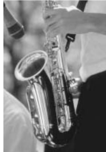
Colour Comes Alive, Jardins botaniques royaux