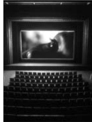
The Paradise Institute, Power Plant