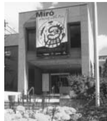
Miro: Playing with Fire, Gardiner Museum of Ceramic Art

Pour aider nos clients à attirer encore plus de visiteurs et visiteuses, le FMCO a conçu une trousse de marketing autodidactique intitulée « Planifiez en vue du succès »; cette dernière guide les organismes culturels dans les étapes que supposent la recherche et la planification d'un événement à succès. Cette trousse de marketing est conçue pour aider des organismes culturels à devenir plus efficaces pour ce qui est de rejoindre des publics potentiels. Elle peut être une ressource précieuse pour tout organisme culturel, pas seulement pour les clients du FMCO. En plus de cette trousse, le personnel du FMCO a fourni des conseils et d'autres formes de soutien, selon les demandes des clients.