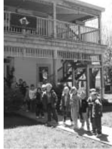
Portes ouvertes Ontario, Fondation du patrimoine ontarien.

Pour minimiser les exigences auxquelles sont soumis le personnel et les bénévoles des organismes demandeurs, le FMCO a pris soin de communiquer clairement les objectifs visés par le Fonds et de concevoir un processus d'approbation efficace. Il faut suivre un processus de demande en deux phases pour obtenir un investissement de la part du FMCO. À la phase 1, l'admissibilité des organismes se détermine à l'aide d'un formulaire simple de deux pages. Seuls les groupes admissibles passent à la demande plus détaillée de la phase 2. Le conseil d'administration du FMCO prend ses décisions de financement quant aux demandes de la phase 2 en s'appuyant sur l'aide et sur les conseils fournis par le personnel du FMCO. À ce jour, une grande proportion des organismes ayant été invités à soumettre une demande de phase 2 ont été approuvés pour fins de financement. Ces clients touchent généralement une grande partie du montant qu'ils désirent obtenir. Le FMCO a reçu des demandes de grande qualité; il s'est engagé à accorder un financement complet aux projets qui présentent de bonnes chances de succès.