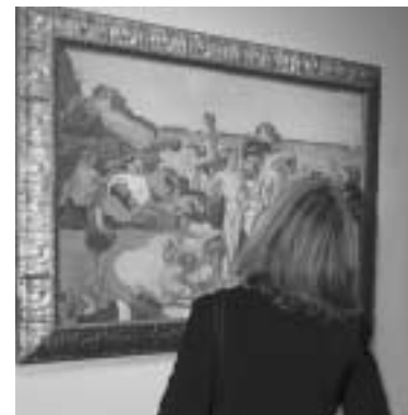
Voyage into Myth, Musée des beaux-arts de l'Ontario